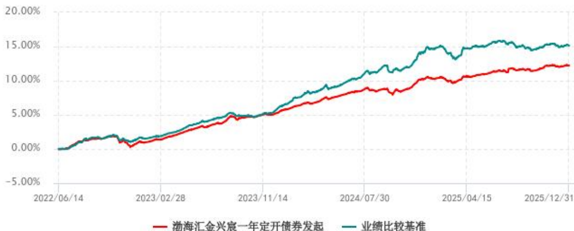
渤海汇金兴宸一年定期开放债券型发起式证券投资基金累计净值增长率与业绩比较基准收益率历史走势对比图 (2022年06月14日-2025年12月31日)