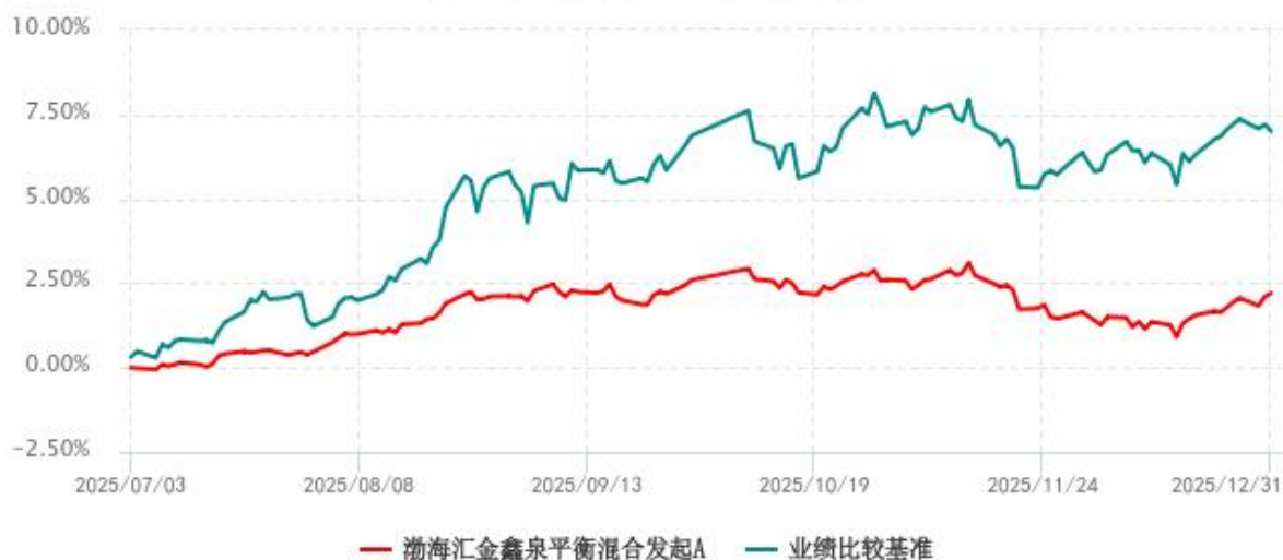
渤海汇金鑫泉平衡混合发起A累计净值增长率与业绩比较基准收益率历史走势对比图 (2025年07月03日-2025年12月31日)